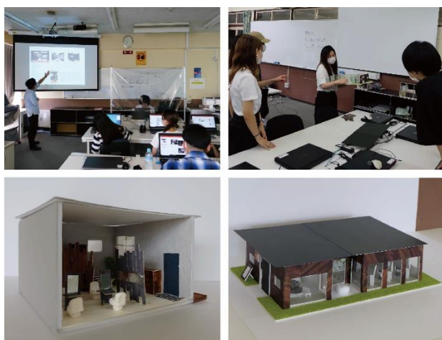
写真1 事例研究の様子

美容学生との打合せのために、事前に事例研究(ケーススタディ)を実施した。A3パネルとスタディ模型を作成し、美容院のスケールを捉えた。また、学内講評会を実施することで、お互いの情報を共有した(写真1)。