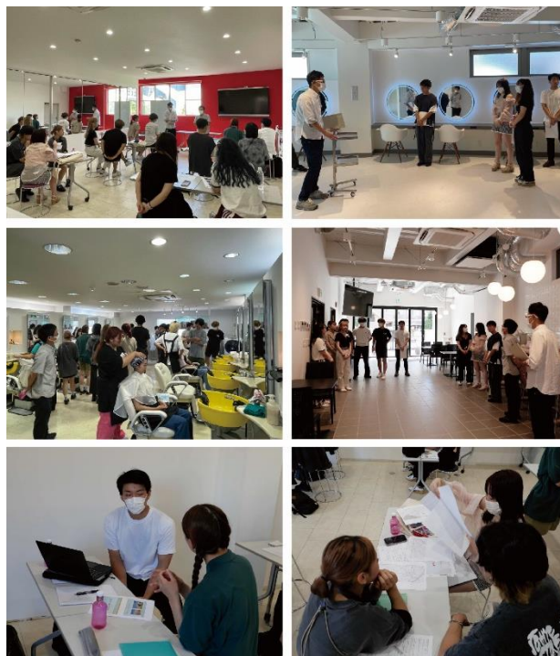
写真5 見学会・ヒアリングの様子(2023年度)

本年度(2023年度)は、美容院を有する住宅(併用住宅)という課題に取り組んでいる。そのため、美容院のデザインの検討をすることと同時に居住者の生活スタイルを踏まえた条件を整理する必要がある。特に仕事をするスタッフと顧客及び居住者の行動を想定し、プライベートな空間とパブリックな空間の使い分けの検討をした。また、打合せの中で土地特有の気候や風土の調査や「まち」への繋がりも検討している(写真5)。