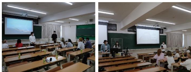
写真3 中間発表会の様子

中間発表会では、今までの打合せの中で得たアイデアをまとめ、各々のスタディした作品の発表を行った。具体的に可視化された空間(スタディ案)を元に、美容院の立ち寄りやすさ、開放感や癒し効果など、顧客の求めるニーズを見直し、インテリアの整合性について再検討した(写真3)。